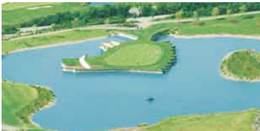
Гольф-клуб Харденберг, Леверкузен, Extrupo/Экструполь изоляция основания 1.400 м 2