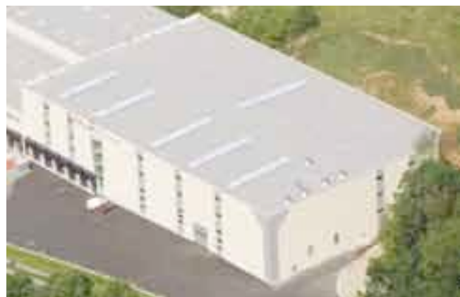
Фирма PUFAS г.Ханн.Мюнден, ExtruPol/Экструполь изоляция крыши, 7.100 м 2