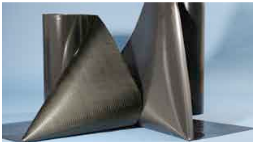
Традиционно:ExtruBit Изолирующие полотна фирмы Schedetal.

Гибкие методы работы производства и правильный, безошибочный подбор системы SCHEDETAL предоставляют пользователям системы изоляции самую высокую меру: надёжность и уверенность.