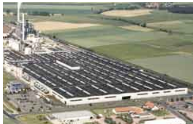
Кроношпан, Лампертсвальде, ExtruBit/Экструбит площадь крыши 117.000 м 2