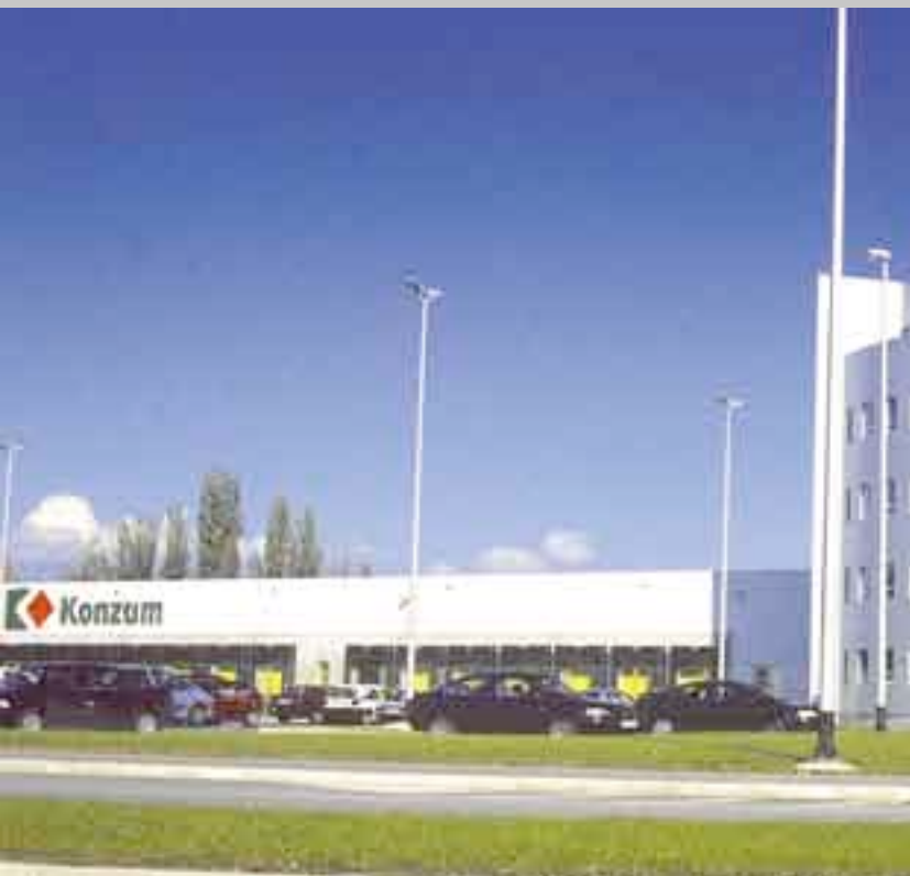
Консум в Загребе/Хорватия, ExtruBit/Экструбит изоляция крыши, 25.000 м 2