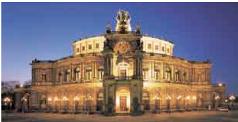
Дрезденский оперный театр, ExtrubiT/Экструбит изоляция крыши 1.800 м 2

К строительным объектам, где использовался материал фирмы SCHEDETAL относятся строения различной архитектуры, в разных местах и различного пользования: к примеру известные торговые сети, крупные логистические предприятия, государственные учреждения и интернациональные аэропорты в Германии, Европе и по всему миру.