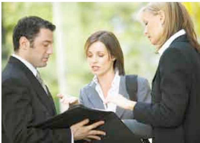
Пути, разрешающие проблемы покупателя, находятся в партнёрских переговорах.