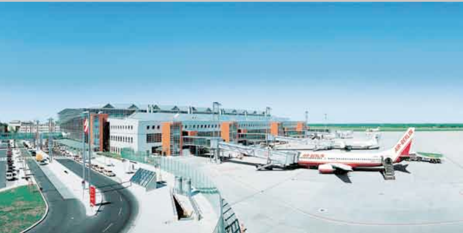
Аэропорт в г. Дрезден, Extrupo/Экструполь изоляция крыши 6.350 м 2